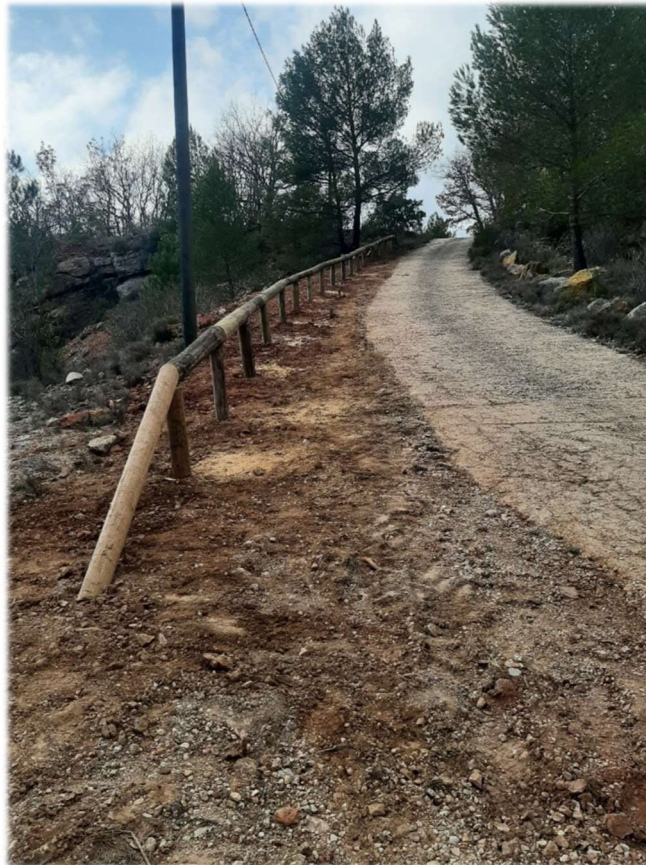
Figure 1 : Rambarde de sécurité longeant la descente d'accès au stand